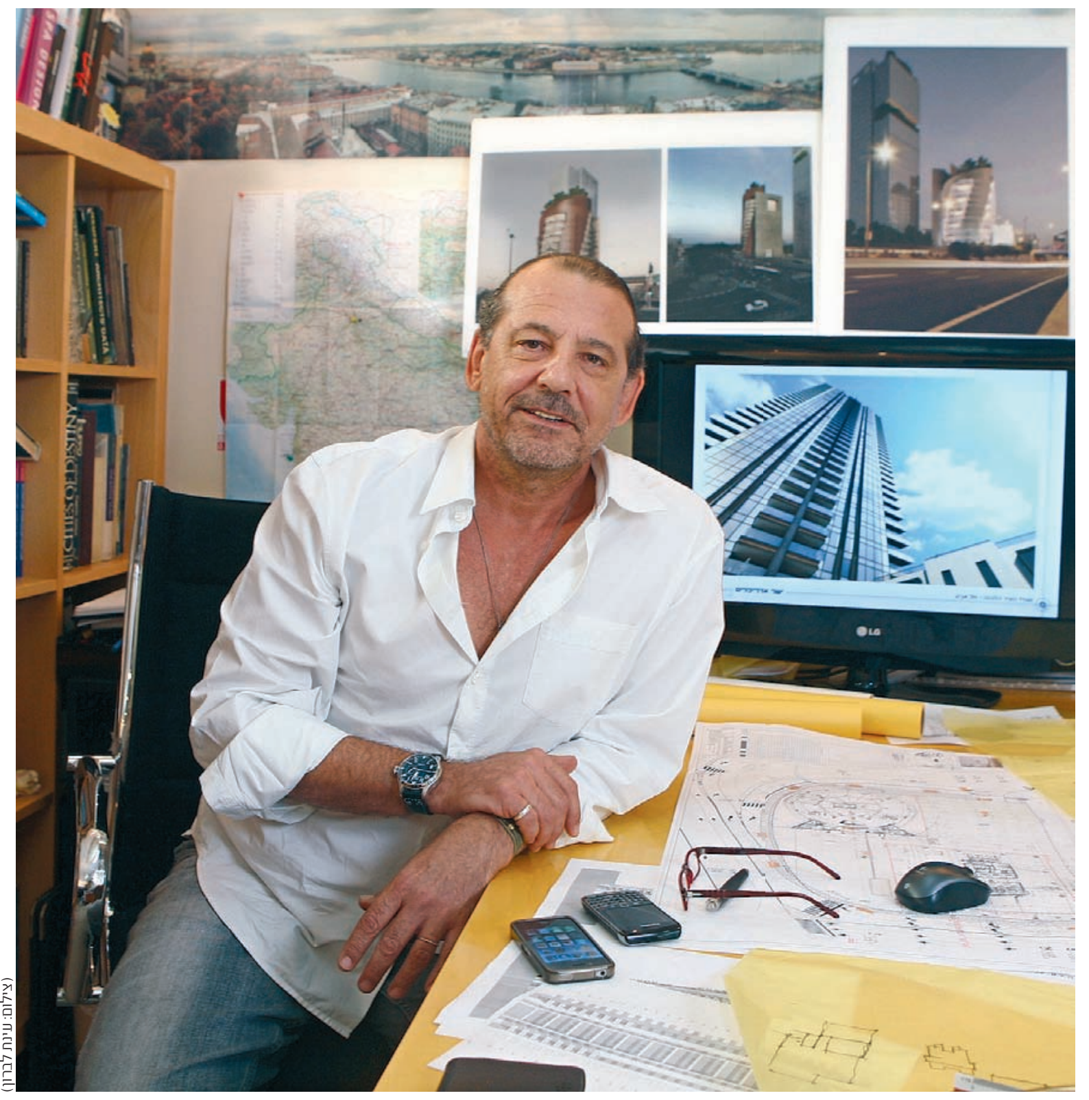
הדמיית בחו"ל "בחברה טובה"