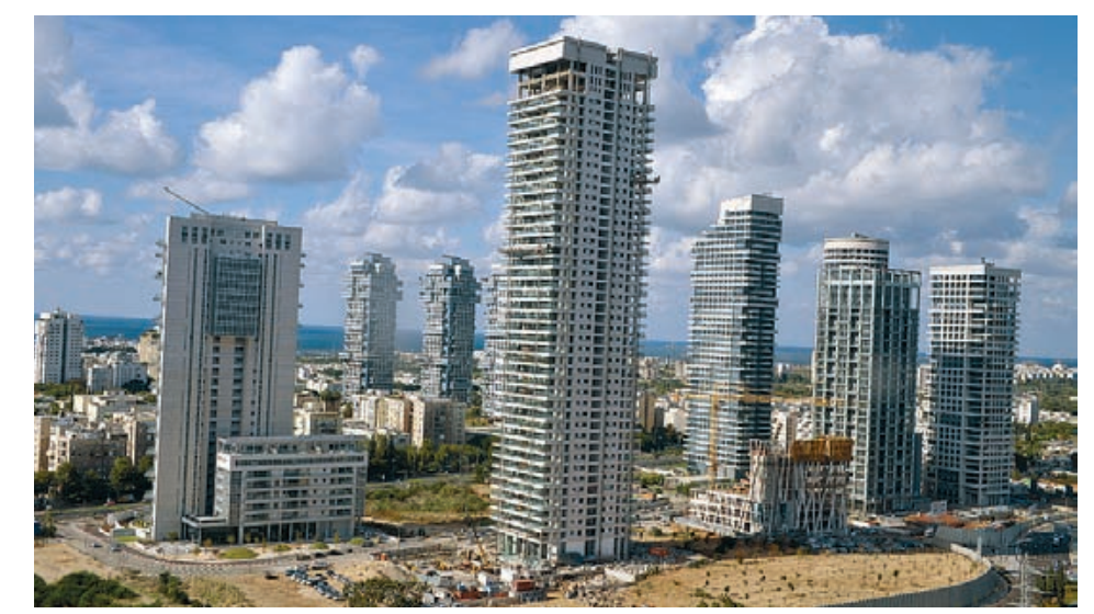
פארק צמרת. "מקרה מבחן"

■ בזכות השמיים "המגדלים אינם אופציה, הם כורח - מי שסבור שאפשר לוותר על בנייה לגובה, או למצוא לה תחליף, לא יודע מה הוא שט. זה הפתרון היחיד המתקבל מהנוסחה המחשבת את היחס בין גודל השטח לכמות האוכלוסייה. בארה"ב רוב הבנייה, גם בערים, היא קומה אחת או שתיים, כי בארץ לעומת זאת, עומדת לפני פיצוץ אוכלוסייה. ב-2048, שנת 100 למדינה, יהיו בשטח ישראל בין 15 ל-20 מיליון איש. יש כמובן אפשרות ליישם את היום כדי לבנות עוד בתים או לכסות את הגג ושטחי בוטלות ובתים דווקא שמיים. מי ישלם על התשתית שתוכנית כוח מחייבת את הצנרת, הכבישים, פתרונות התעסוקה? מי יספוג את יהום האוויר שינוי בתרונות התחבורה לתחישבות בסגנון כזה חזק מזה, לגור בשמיים? זה נפלא. זה לא פחות כסף ולא פחות טבעי מלגור על הקרקע".